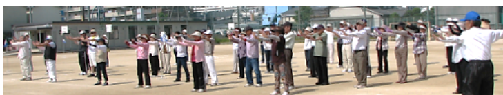
(グルコサミン体操！)