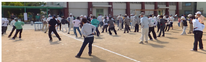
(ぐるぐるぐるぐる…準備運動中)