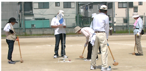
(熱く真剣なまなざしで…！)