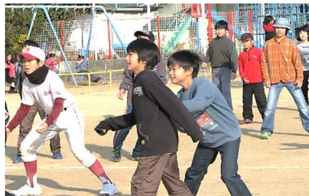
(真剣な構え・目つき)