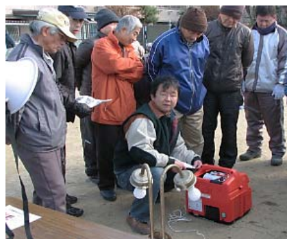
(カセットボンベによる発電機)