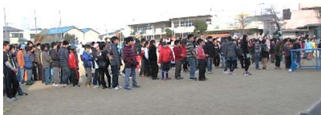
(開 会 式)

12チームが6コートに散らばり、2試合制で実施。大きな歓声があがり、充実したひとときでした。