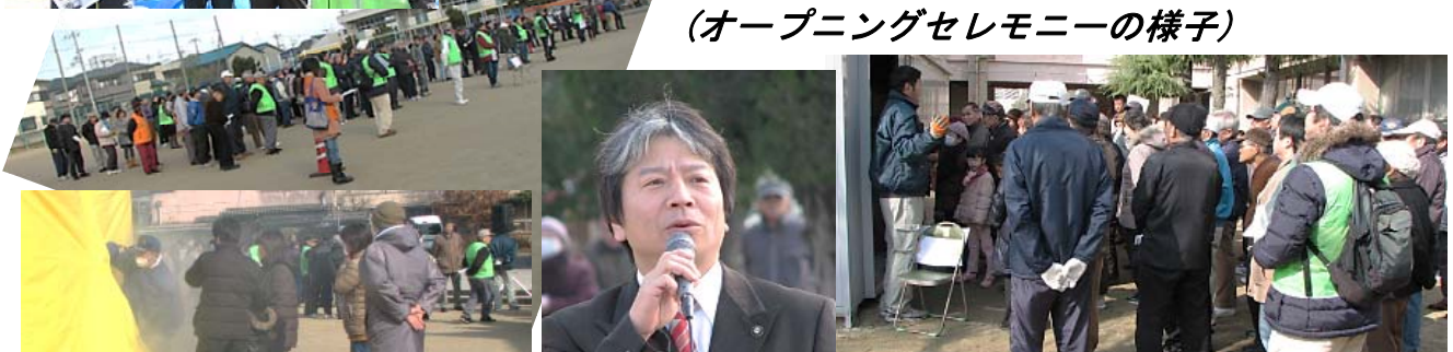
(備蓄倉庫開示…各家庭でも一週間分キープが理想)